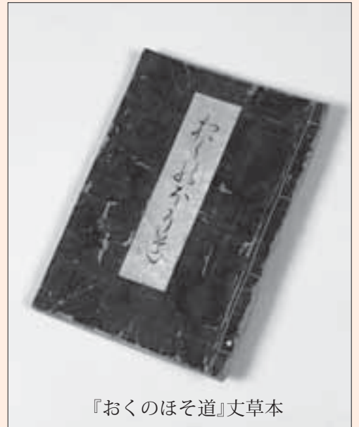
『おくのほそ道』文草本

山形領に立石寺と云山寺あり。慈覚大師の開基にして、殊静閑の地也。一見すべきよし、人々のすゝむるに依て、尾花沢よりとつて返し、其間七里ばかり也。日いまだ暮ず。麓の坊に宿かり置て、山上の堂にのぼる。岩に巖を重て山とし、松栢年旧、土石老て苔滑に、岩上の院々扉を閉て物の音きこえず。岸をめぐり、岩を這て、仏閣を拝し、佳景寂寞として心すみ行のみおぼゆ。